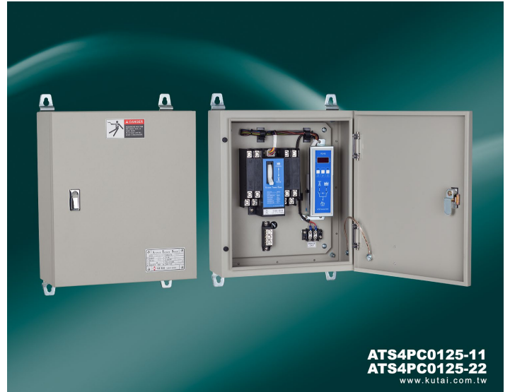
ATS4PC0125-11 ATS4PC0125-22 www.kutai.com.tw

*另有 ATS4PC0125-2 機種，TC-V2 數位控制模組安裝於面板之 ATS 箱體